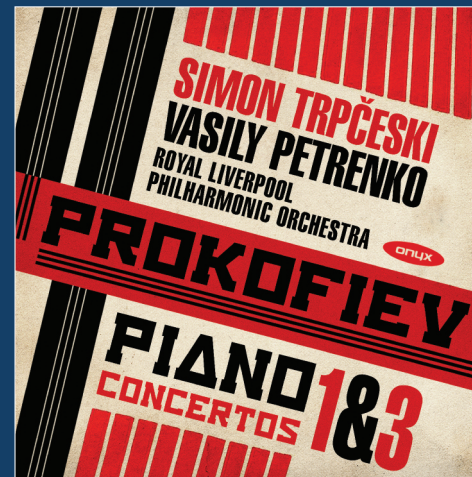
ONYX 4140 Prokofiev: Piano Concertos 1 & 3 Simon Trpčeski, RLPO, Vasily Petrenko