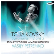
ONYX 4150 Tchaikovsky Symphonies 1, 2 and 5 Royal Liverpool Philharmonic Orchestra, Vasily Petrenko