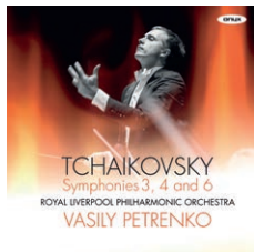
ONYX 4162 Tchaikovsky Symphonies 3, 4 and 6 Royal Liverpool Philharmonic Orchestra, Vasily Petrenko