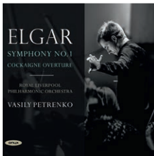
ONYX 4145 Elgar Symphony No.1 Royal Liverpool Philharmonic Orchestra, Vasily Petrenko