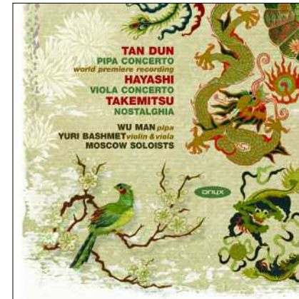
ONYX 4027 TAN DUN PIPA CONCERTO/TAKEMITSU NOSTALGHIA & 3 FILM SCORES/HAYASHI VIOLA CONCERTO