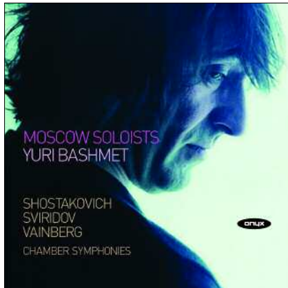
ONYX 4007 SHOSTAKOVICH, SVIRIDOV, VAINBERG CHAMBER SYMPHONIES Grammy Nomination 2006